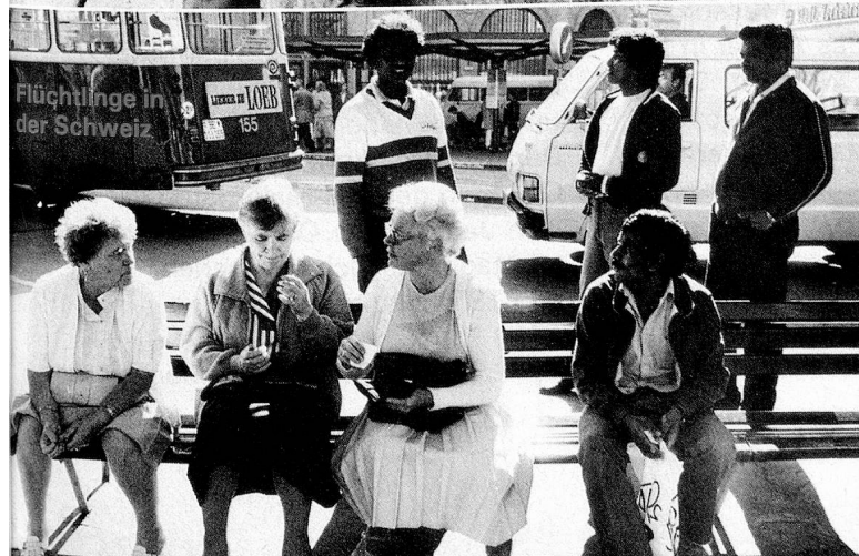
Flüchtlinge in der Schweiz