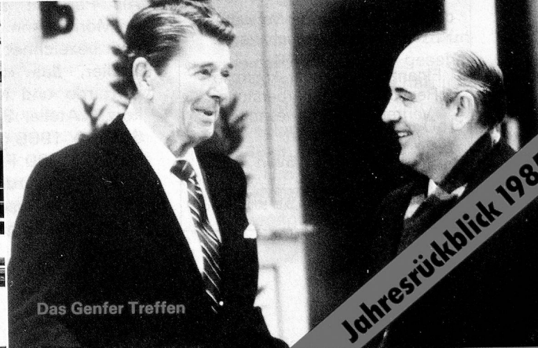
Das Genfer Treffen