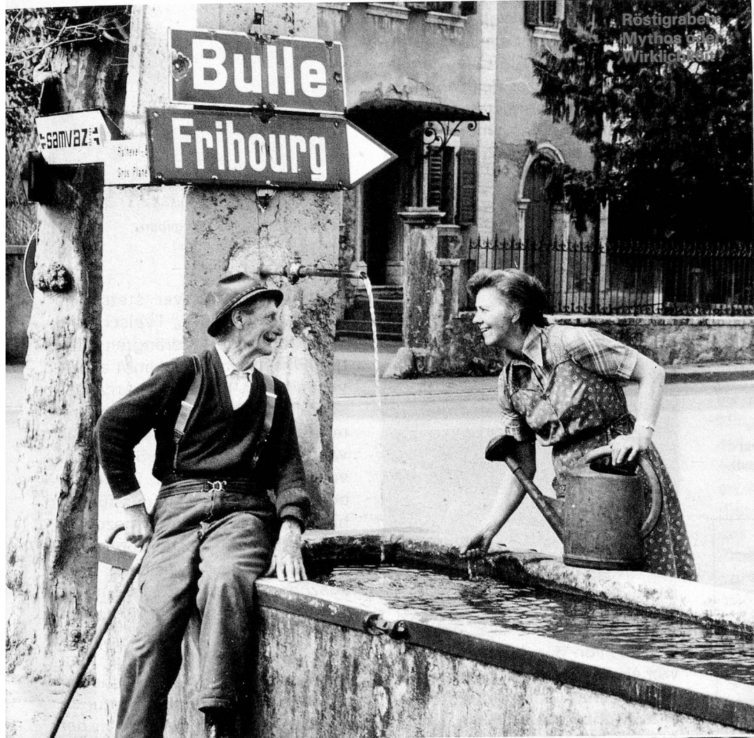
Röstigraben Mythos oder Wirklichkeit?