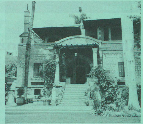
Swiss Club Cairo: Club House/Maison Suisse ("Villa Pax")