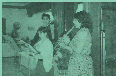
Musikantinnen des Vereins.

jouissons d'une agréable croisière sur le lac de Traun en faisant quelques interruptions pour visiter le chateau Ort et la célèbre église de Traunkirchen. La soirée fut également un triomphe: un magnifique buffet garni, un délice pour la langue et les yeux. Après les discours de ces Messieurs les ministres et