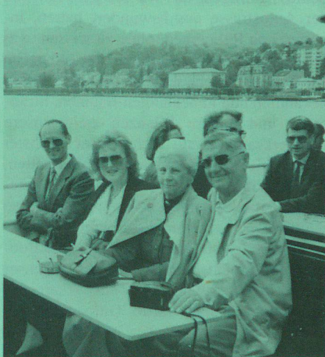
Auf dem Traunsee.

jouissons d'une agréable croisière sur le lac de Traun en faisant quelques interruptions pour visiter le chateau Ort et la célèbre église de Traunkirchen. La soirée fut également un triomphe: un magnifique buffet garni, un délice pour la langue et les yeux. Après les discours de ces Messieurs les ministres et