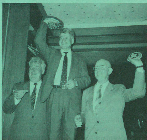
Die Sieger des Quiz. Zu erraten waren 12 Schweizer Lieder.

Le beau temps n'était pas de la partie, mais c'était une belle journée tout de même. La partie officielle du matin passée et après un bon dîner, nous nous retrouvons au débarcadère. Délégués et membres, tout le monde est content de se revoir, de l'ainée de 80 ans à la cadette de 8 mois. Sur le bateau, nous