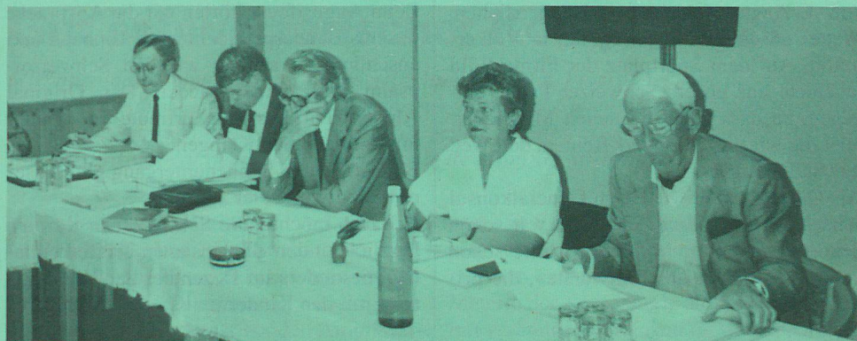
An der Tagung