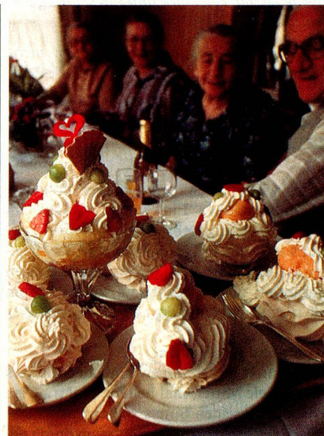
Klassisches Emmentaler Dessert.

selbst der eigenen Heimat nie ganz auf den Sprung gekommen zu sein?