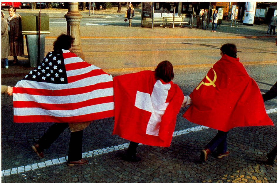
Ost und West verbinden sich.

Sie reichen von der Schule des Kindes über die «Schule des Mannes» (Militär) bis zur Discoattraktion, die später verboten worden ist. In kontrastierender Weise folgt auf das Tabu Tod der Offiziersball, dann Asylantenbaracken, anschliessend spielende und kranke Kinder. Unter der vieldeutigen Bezeichnung «Klima Schweiz» finden sich Bilder vom Computer im Kuhstall neben einer Modeschau, ein 1.-August-Feuer genauso wie der Berner Zwiebelmarkt und, ganz besonders gelungen, ein Pferdefuhrwerk, das