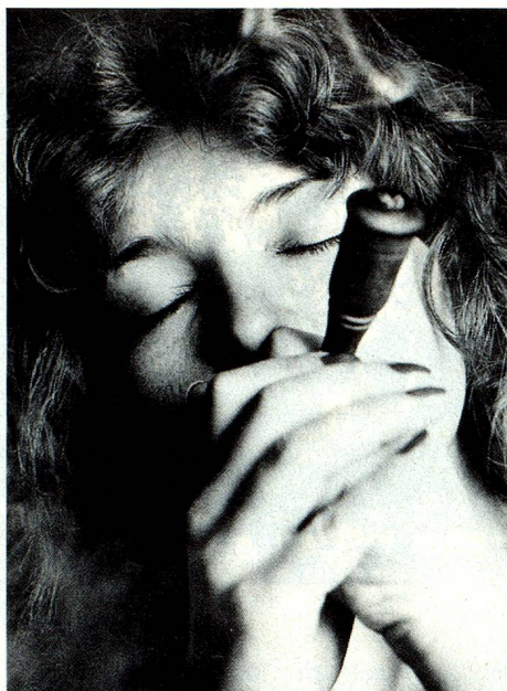
Chilum, eine Art Pfeife zum Haschischrauchen.

Ich komme nun auf die vier erwähnten Faktoren zurück, die zur Entstehung einer Sucht beitragen können. Denn hier liegen auch unsere Möglichkeiten einzugreifen. Im folgenden illustriere ich jeden dieser Bereiche mit einem Beispiel unserer Einflussmöglichkeiten.