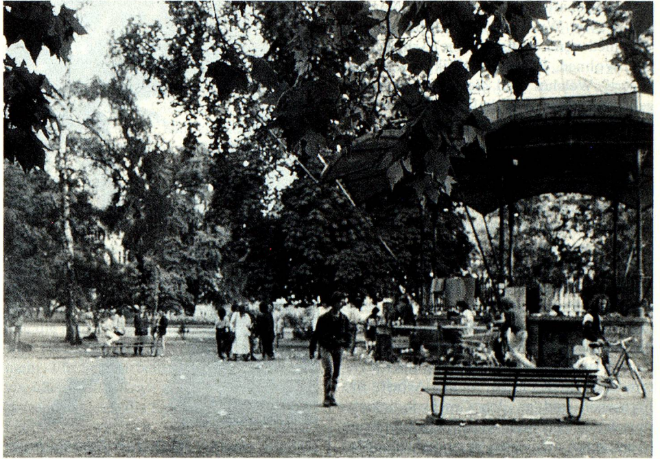
Die aktuelle Zürcher Drogenszene am Platzspitz.