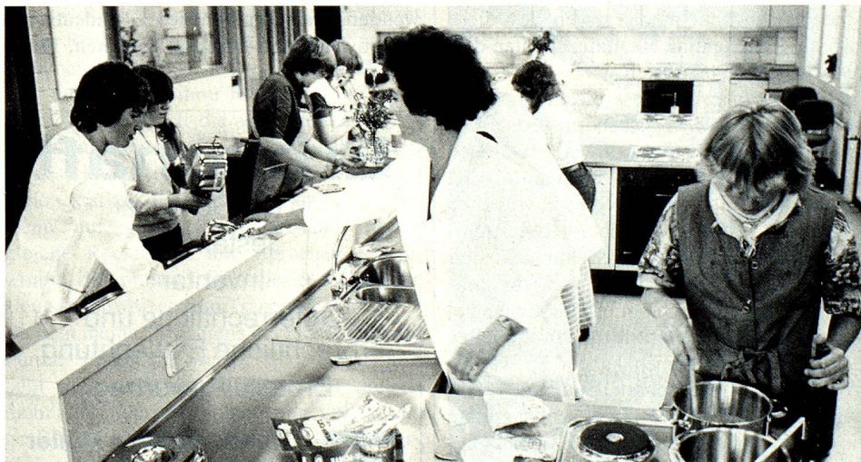
Gerade im praxisbezogenen Unterricht bevorzugen die Lehrer den schülernahen und «herrschaftsfreien» Dialekt.

Eine erste starke Gegenbewegung gegen diese kulturelle «Überfremdung» ging schon vor dem Ersten Weltkrieg von Bern aus und erfasste nach der Niederlage des Reichs bald die ganze deutsche Schweiz. Sie wurde verstärkt in der Nachkriegszeit mit ihrer Betonung der Demokratie und des Föderalismus, die beide in den verschiedenen Kantonsdialekten symbolisiert werden konnten, und erfuhr ihre staatliche Aufwertung in der Zeit der Geistigen Landesverteidigung, in der das Schweizerdeutsche als Bollwerk gegen den Nationalsozialismus of-