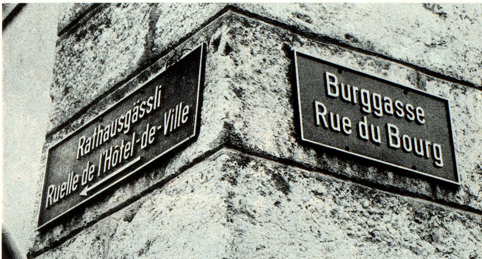
Die Zweisprachigkeit in der Stadt Biel/Bienne wirkt sich bis in die Verschiedenheit der Lehrpläne und Ferienregelungen aus.

Die Romandie hat kein gemeinsames Zentrum, sie bildet keine Einheit. Die politischen Institutionen sind völlig verschiedenartig; so ist die Gemeindeautonomie im Wallis extrem gross, in Genf fast inexistent. Die Kantone unterscheiden sich in der konfessionellen Tradition, die immer noch durchschimmert: in der Abstimmung über den Schwangerschaftsabbruch bildete sich über die Sprachgrenzen hinweg ein katholischer «Sonderbund». «Progressistisch» sind meist nur die Kantone im Jura oder in Juranähe: Genf, Waadt, Neuenburg und Jura, zu denen oft auch die beiden Basel stossen. Wichtige Entscheidungszentren liegen aus-