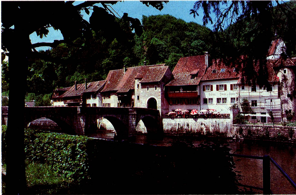
Konkret gibt es keinen Röstigraben; er ist lediglich ein treffendes Bild für die wachsenden Mentalitätsunterschiede zwischen Deutsch und Welsch. Unser Bild: St. Ursanne (Kt. Jura).

tochter «la sommelière» (nicht «la serveuse»), das Kuchenblech «plaque à gâteau» (nicht «moule à tarte»). Und es gibt Westschweizer Ausdrücke, die für Franzosen ebenso unverständlich sind wie Schweizerdeutsch für Deutsche, etwa: «Une voiture te gicle en roulant dans une gouille» (Ein Wagen spritzt dich beim Durchfahren einer Pfütze an). Doch zahlreiche Helvetismen – so «röstis» und «yasse» glänzen inzwischen bereits im «Petit Larousse».