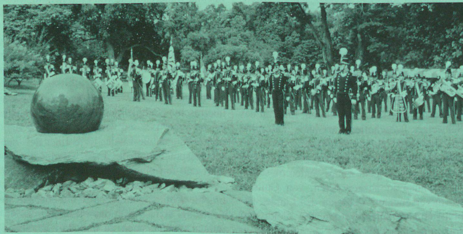
Kugelbrunnen im Botanischen Garten Singapur.

produzent «den Narren gefressen» zu haben schien. That's it! Ein Monument, das drei elementare «Ressourcen» der Schweiz in sich