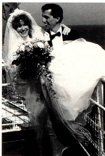
Heirat mit einem Schweizer bedeutet für eine Ausländerin nicht mehr automatisch Schweizer Bürgerrecht.

(Nähere Angaben werden Sie einem speziellen Merkblatt entnehmen können, welches Ihnen ab Dezember dieses Jahres bei den Schweizer Vertretungen zur Verfügung stehen wird).