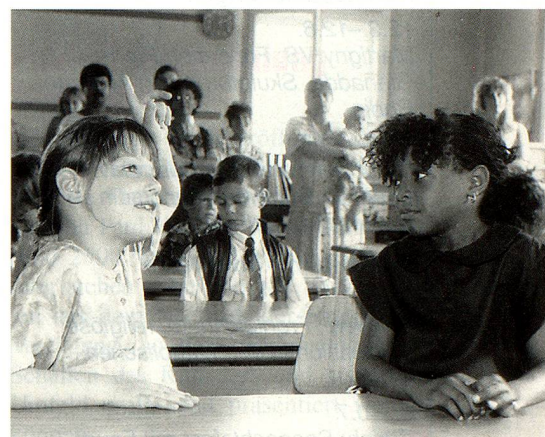
Wer in der Schweiz die Schule besucht, soll sich erleichtert einbürgern lassen können, meinen Behörden und Parlament. Und das Volk?

Der Gesetzesartikel ist vage formuliert: «Der Bund erleichtert den jungen, in der Schweiz aufgewachsenen Ausländern die Einbürgerung». Der zuständige Bundesrat, Arnold Koller, ergänzte, dass die Altersgrenze zwischen dem 15. und 24. Altersjahr gezogen werde. Theoretisch könnten also 140 000 Ju-