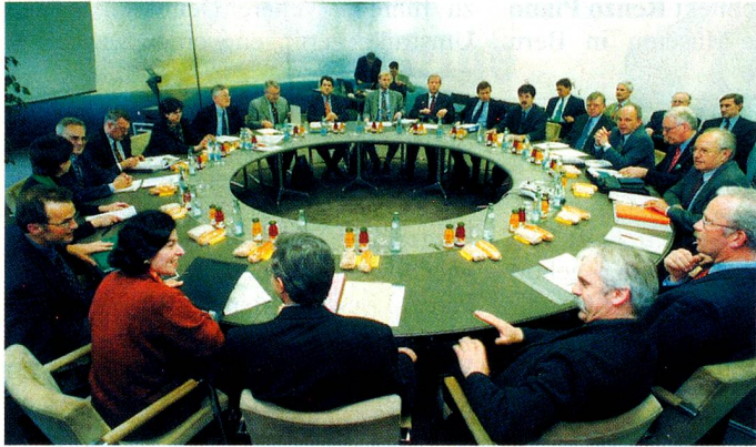
Die Gespräche am Runden Tisch haben zur langfristigen Sanierung der Bundesfinanzen beigetragen.