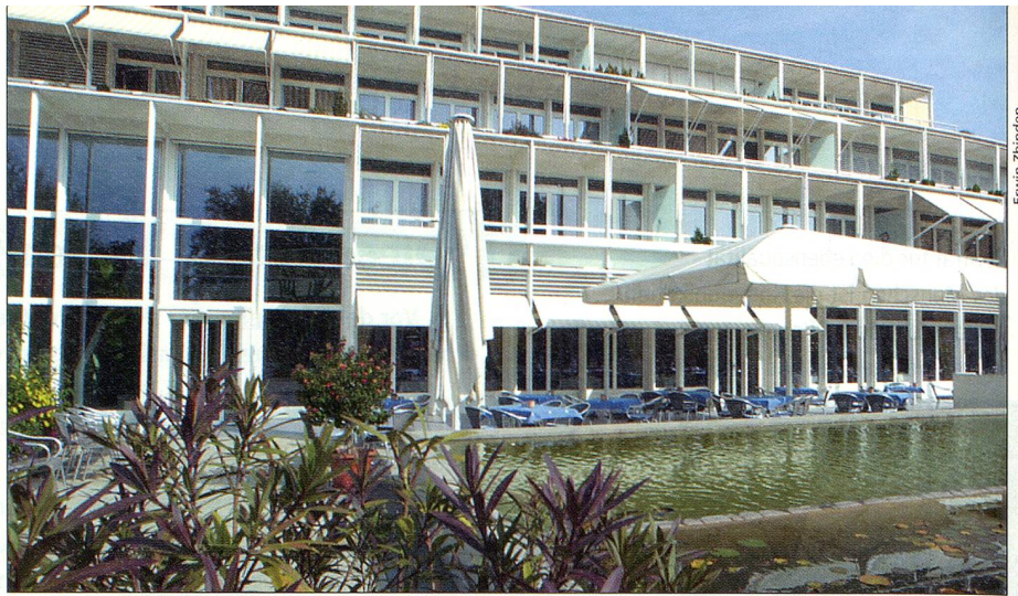
Luxusvariante für gehobene Ansprüche: Die Parkresidenz Meilen.