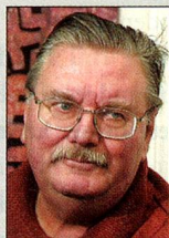
Enfant terrible für viele: Al Imfeld.