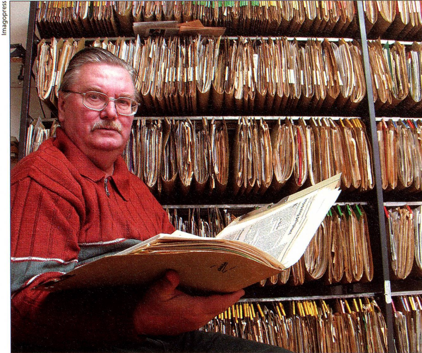
Der Schweizer Religionswissenschaftler Al Imfeld, Afrika-Kenner und Frater der Missionsgesellschaft Immensee.