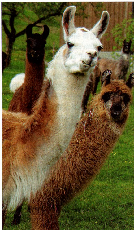
Patrick Lüthy / imagopress

LAMAS UND ALPAKAS aus Südamerika, afrikanische Strausse, Bisons aus den Vereinigten Staaten, tibetische Yaks – das sind einige der exotischen Tiere, denen man seit einigen Jahren in den Schweizer Bergtälern begegnet. Oft werden diese Gattungen von Bauern gezüchtet, welche die traditionelle Landwirtschaft aufgegeben haben, um sich der biologischen Produktion zu widmen. Sie setzen auf Innovation und erzeugen Produkte von hoher Qualität für den regionalen Markt. Das Fleisch der Bisons wird zu Salmi oder Steaks verarbeitet, während jenes der Yaks, das proteinreicher und weniger fett ist, an tibetische und andere Restaurants verkauft wird. Lamas und Alpakas liefern wertvolle Wolle, während das Straussenfleisch ähnlich wie zartes Rindfleisch schmeckt. Auf einigen Bauernhöfen betätigen sich die Züchter/Landwirte auch als Gastwirte und Touristenführer. Solche zusätzliche Verdienstmöglichkeiten finden immer mehr Nachahmung. PC