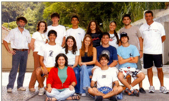
Parabéns para os formandos 2005 ! (3ª Série do 2º grau, na foto com professores)