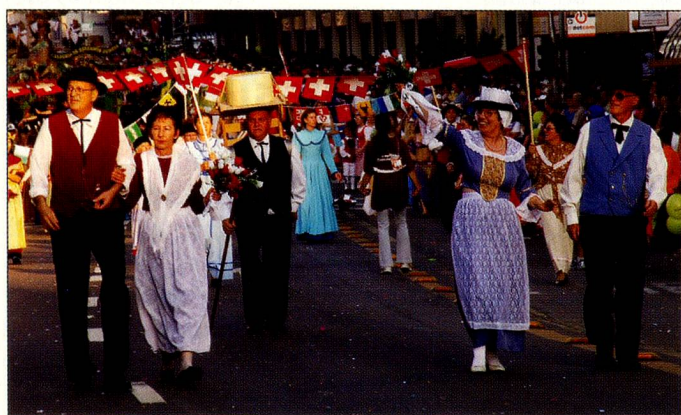
O grupo suíço que participou do primeiro desfile do Corso Alegórico da Festa da Uva 2006

Após a abertura oficial nos pavilhões, houve o desfile na rua principal da cidade, onde um grupo Suíço participou neste dia e em mais seis outros dias.