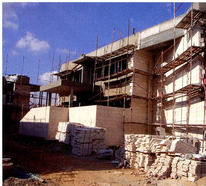
Die neue Schule in Jerusalem im Rohbau.

Im Namen des Vorstandes gratulieren wir allen Eltern und Grosseltern zum Nachwuchs. Die Generalversammlung 2007 steht als Nächstes auf unserem Programm. Näheres ist auf unserer Homepage www.chverein.dk zu finden. Dort ist auch das Jahresprogramm für 2007 veröffentlicht. PIERRE-YVES GAUTSCHI