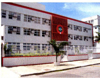
A Escola Suíço-Brasileira na Rua Corrêa de Araújo na Barrinha