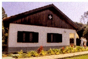
O acolhedor Retiro Suíço

No caso de pacientes em convalescença, o Retiro também é disponível para estadia temporária. Há vagas disponíveis e se desejar maiores informações, visite no site www.beneficencia-suica.com.br ou entre em contato pelo telefone: 11 / 5071-2910.