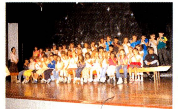
Cerimônia da passagem dos alunos para o 2º ano do Ensino Fundamental

Parabéns aos alunos e professores pelo êxito! A média dos nossos alunos nas provas IB (International Baccalaureate) foi de 30 pontos, mantendo um bom desempenho e abrindo o caminho para os estudos no exterior. Este resultado é uma demonstração de que os alunos da Escola Suíço-Brasileira de São Paulo estão conseguindo atingir os objetivos propostos.