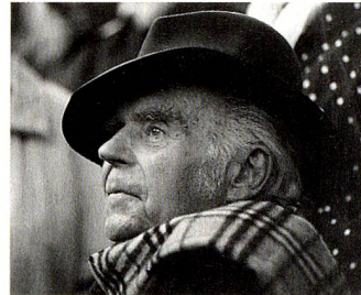
Anlässlich des hundertsten Geburtstages des Schweizer Künstlers Helmut Ammann ist im Schweizer Haus München eine Retrospektive zu sehen.

Für Kultur- und Kunstfreunde bietet das Schweizer Haus ab Ende September eine umfangreiche Retrospektive der Werke des Schweizer Bildhauers und Malers Helmut Ammann (1907–2001).