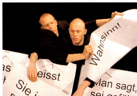
Das Comedy-Duo «Ohne Rolf» gastiert mit seiner Zettel-Pantomime am 15. und 16. Juni im Zebrano-Theater in Berlin.

«Im Vorzimmer des Westens», Fotografien von René Burri aus dem Notaufnahmeger Marienfelde, bis 19.8., Erinnerungsstätte des Notaufnahmeger Marienfelde