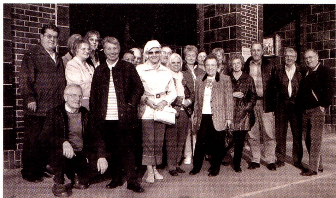
Mitglieder des Schweizer Vereins Berlin «posieren» vor dem Haus des Rundfunks. 155 Meter lang ist die verlinkerte Fassade von Hans Poelzig an der Masurenallee.

Das Haus mit der roten Klinkerfassade, die mit oberitalienischen Stilelementen strukturiert ist, erhielt nicht aus politischen Gründen den Spitznamen «rotes Rathaus», verrät der Führer schmunzelnd den fast vierzig Schweizer Besuchern. Das 1870 eingeweihte Gebäude am Alexanderplatz mit dem monumentalen Treppenhaus samt obligatem roten Teppich, seinen prunkvollen Sälen und dem 94 Meter hoch aufragenden Turm verkörperte das damalige Selbstbewusstsein stolzer Bürger. Preussenkönig Wilhelm, der spätere Kaiser Wilhelm I., der in der Nachbarschaft residierte, war zur Grundsteinlegung zugegen. Zum Richtfest 1867 hingegen glänzte er durch Abwesenheit. Dass die Turmspitze des neuen Rathauses die Kuppel des