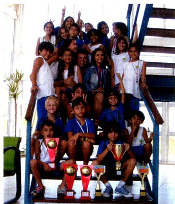
Os atletas do Colégio Marie Jost e seus trofeus

O Colégio Marie Jost se destaca na 13ª Edição dos Jerninhos