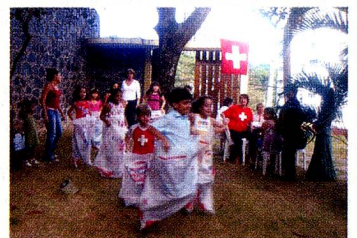
A presença de muitas crianças alegrou a festa.