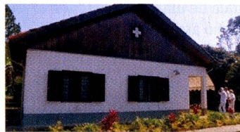
O acolhedor Retiro Suíço

Lembramos que a Associação Suíça de Beneficência Helvetia possui um Retiro Suíço, um lar para idosos, localizado em meio