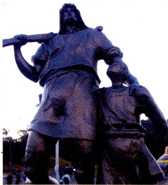
A estátua de Guilherme Tell, medindo quase 4 metros

Já se passaram duas décadas desde a inauguração da Queijaria Escola Suíça, no dia 1º de agosto de 1987, na Estrada Nova Friburgo - Teresópolis, na região serrana do Estado do Rio de Janeiro.