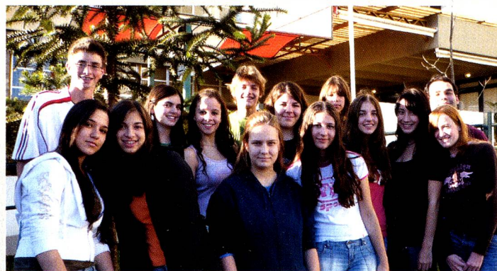
A animada turma do curso de teatro