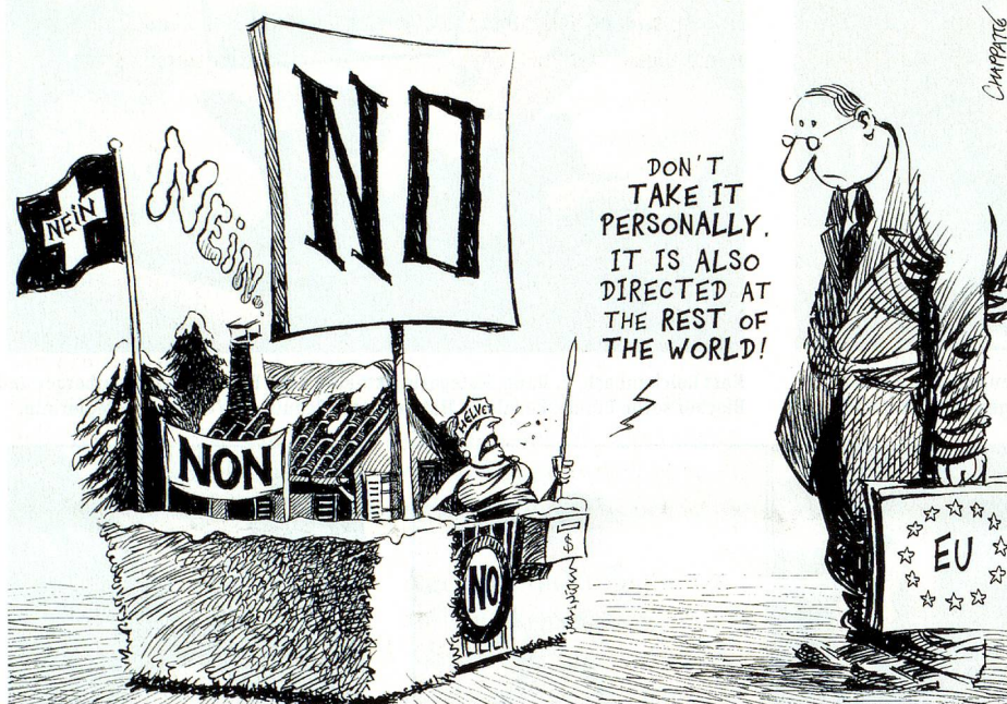
Nein! Nehmen Sie das nicht persönlich. Damit ist auch die restliche Welt gemeint!

Bilaterale Abkommen mit der Europäischen Union oder ein Vollbeitritt unseres Landes – «Europa» ist weiterhin das wichtigste Thema unserer Aussenpolitik. Die Zukunft des bilateralen Weges wird schwieriger, aber eine Mehrheit des Schweizervolkes und die Wirtschaft wollen heute keine volle Mitgliedschaft. Von Rolf Ribli