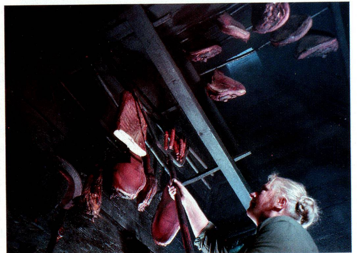
Burgunderkamin im Val d'Illier.