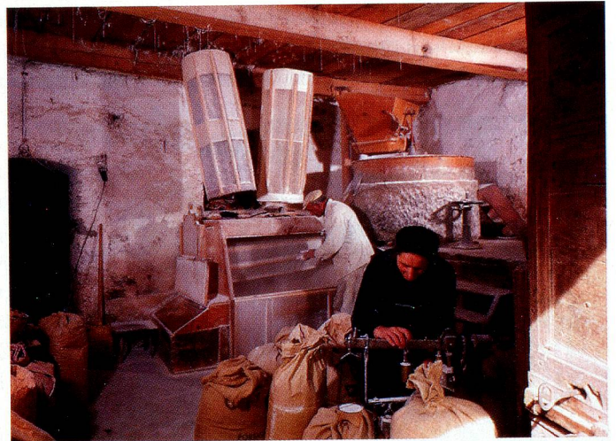
Kornmühle in Poschiavo.