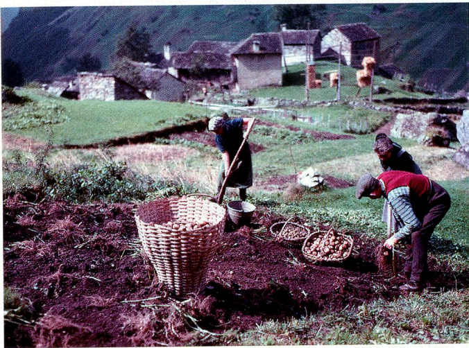
Kartoffelесе in Malvaglia.

Bergleben. Peter Ammon (1924) ist einer der ersten Schweizer Fotografen, der bereits in den Fünfzigerjahren grossformatige Farbbilder machte. Als damals 25-Jähriger faszinierte ihn vor allem das Schweizer Bergleben. Die in diesem Buch erstmals publizierten 125 Aufnahmen zeigen ein Stück Schweiz, wie es in dieser Art selten dokumentiert worden ist. Das Buch kostet 78 Franken und ist in allen vier Landessprachen erschienen. www.aura.ch