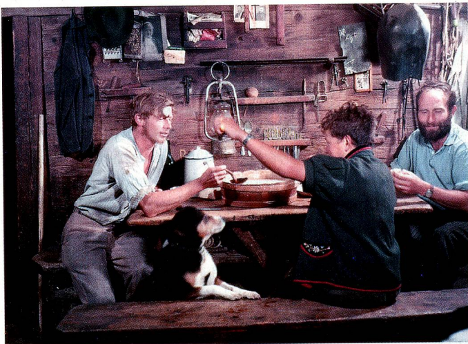
Suifi auf der Alp Gummen in Nidwalden.