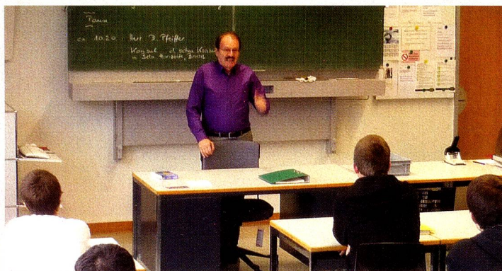
O Cônsul Honorário da Suíça em Belo Horizonte proferiu palestra em Berna.

dado a ir ao Café Federal, no dia da eleição do novo ministro, o "Bundesrat" Didier Burkhalter, e teve a oportunidade de cumprimentar todos os ministros e o presidente da Suíça, Rudolf Merz. Foi um almoço inesquecível e inédito, que só pode acontecer na Suíça nestas circunstâncias.