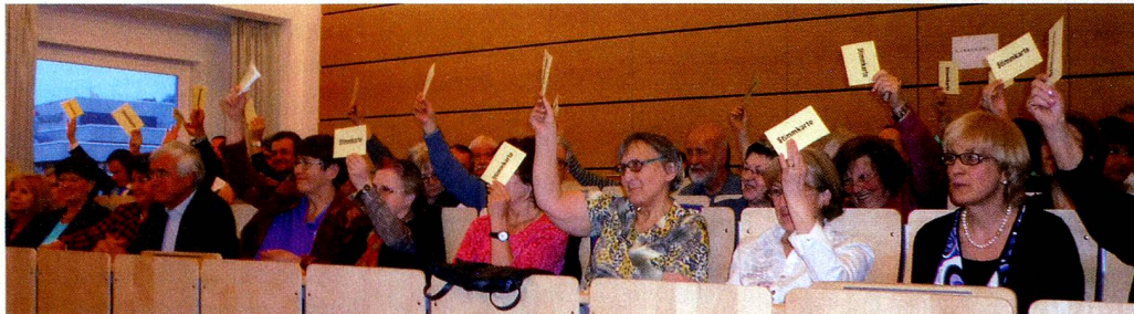
Mitbestimmen macht offensichtlich Spass: Mitglieder der Schweizer Gesellschaft Stuttgart