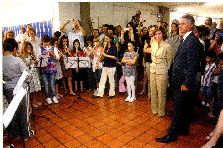
O Conselheiro Federal da Suíça, Sr. Didier Burkhalter e esposa, na Escola Suíço-Brasileira de São Paulo