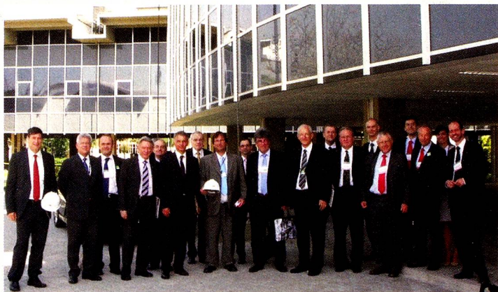
O Conselheiro Federal Didier Burkhalter (6° a partir da esquerda) e a delegação Suíça no CENPES, Centro de Pesquisas da Petrobras, no dia 27.08.2010.

Visita ao Brasil do Conselheiro Federal Didier Burkhalter