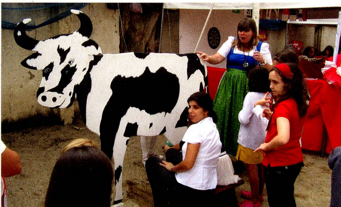
Na Festa Suíça, a brincadeira de tirar o leite da vaca fez sucesso!

Na ocasião, contamos com a presença de muitos compatriotas, amigos da Suíça e famílias da Escola, que tiveram a oportunidade de vivenciar um pouco da cultura local, bem como desfrutar da gastronomia e das brincadeiras típicas. A festa encerrou com o tradicional cortejo de lanternas.