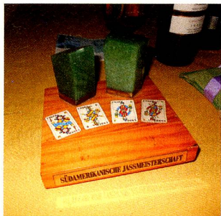
Este ano, o tradicional troféu ficou com o campeão Alfred Ganz.