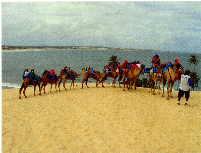
O inusitado passeio de dromedário encanta a todos.