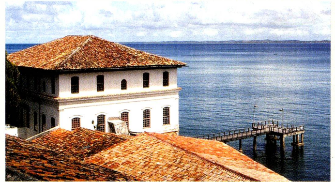
O MAM - Museu de Arte Moderna da Bahia

O MAM fica na Avenida do Contorno s/nº, Solar da União, em Salvador / BA ( www.mam.ba.gov.br ): vale conferir o prestigiado trabalho destes artistas.