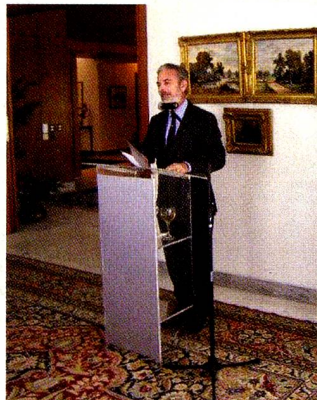
Sr. Antonio Patriota, Ministro brasileiro das Relações Exteriores, na residência da Embaixada da Suíça em Brasília.

No contexto da Francofonia e a convite do Embaixador da Suíça, o Ministro brasileiro das Relações Exteriores, Sr. Antonio Patriota,