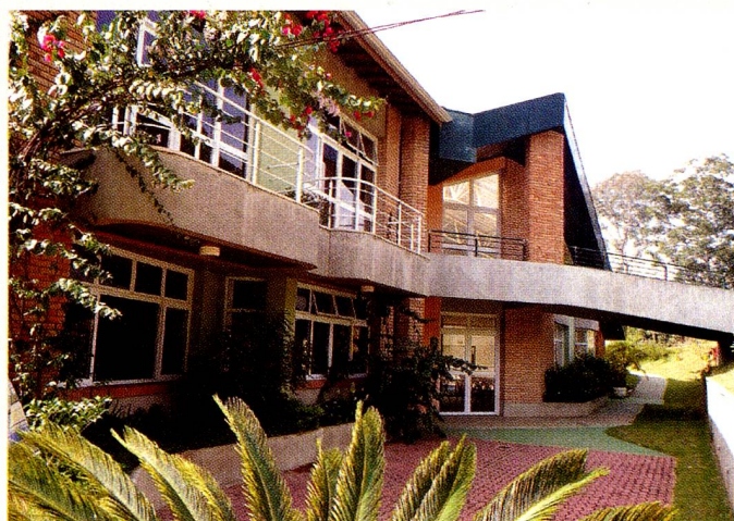
O acolhedor Retiro Suíço em Campo Limpo Paulista

Nossas funções básicas são filantrópicas, ajudando e apoiando pessoas com dificuldades. Porém, a atividade principal é administrar o Retiro Suíço , um lar acolhedor para idosos e pessoas convalescentes. Nosso objetivo principal é ser uma extensão do lar, proporcionando aos residentes um ambiente familiar de paz, sossego e tranquilidade. Oferecemos aos hóspedes, além do ambiente tranquilo, uma alimentação saudável, enfermagem e assistência médica, hidra- e fisioterapia, atelier para trabalhos manuais e locação em apartamentos ou chalés individuais com facilidades privativas. Desde a decoração ao atencioso atendimento, em nada lembra