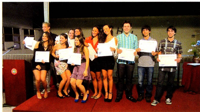
Os formandos de 2011

O resultado dos nossos alunos ficou acima da média mundial.