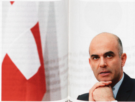
Alain Berset bei seinem ersten Auftritt vor den Medien nach seiner Wahl zum Bundesrat

Nach ihrer problemlosen Wiederwahl hat das Parlament Eveline Widmer-Schlumpf auch noch mit einem Glanzresultat zur Bundespräsidentin für das laufende Jahr gekürt. Vizepräsident ist Ueli Maurer. Neuer Vizepräsident des Departements für Auswärtige Angelegenheiten (EDA) wird Bundesrat Didier Burkhalter. Der Freisinnige aus Neuenburg leitete seit seiner Wahl in den Bundesrat 2009 das Departement für Inneres (EDI). Dieses übernimmt nun Alain Berset. Die anderen fünf Bundesräte führen die gleichen Departemente wie vor den Wahlen.