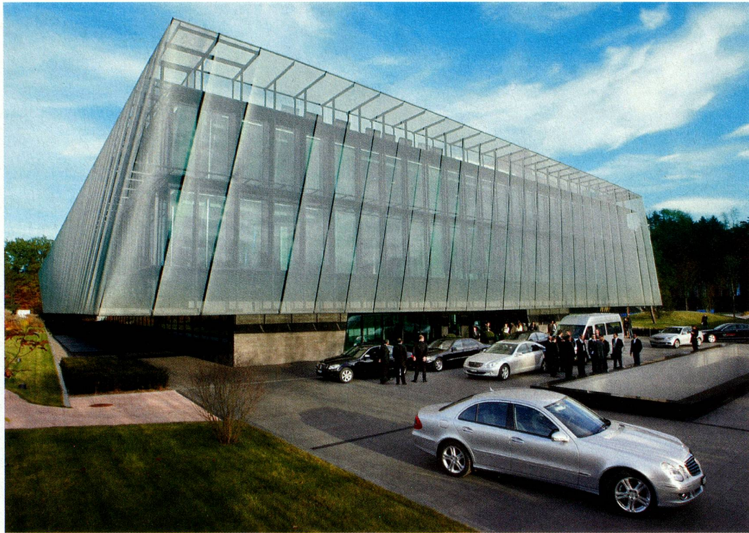
Vorfahrt der Funktionäre beim Hauptgebäude der FIFA in Zürich

des Exekutivkomitees, dem 24-köpfigen Führungsgremium.