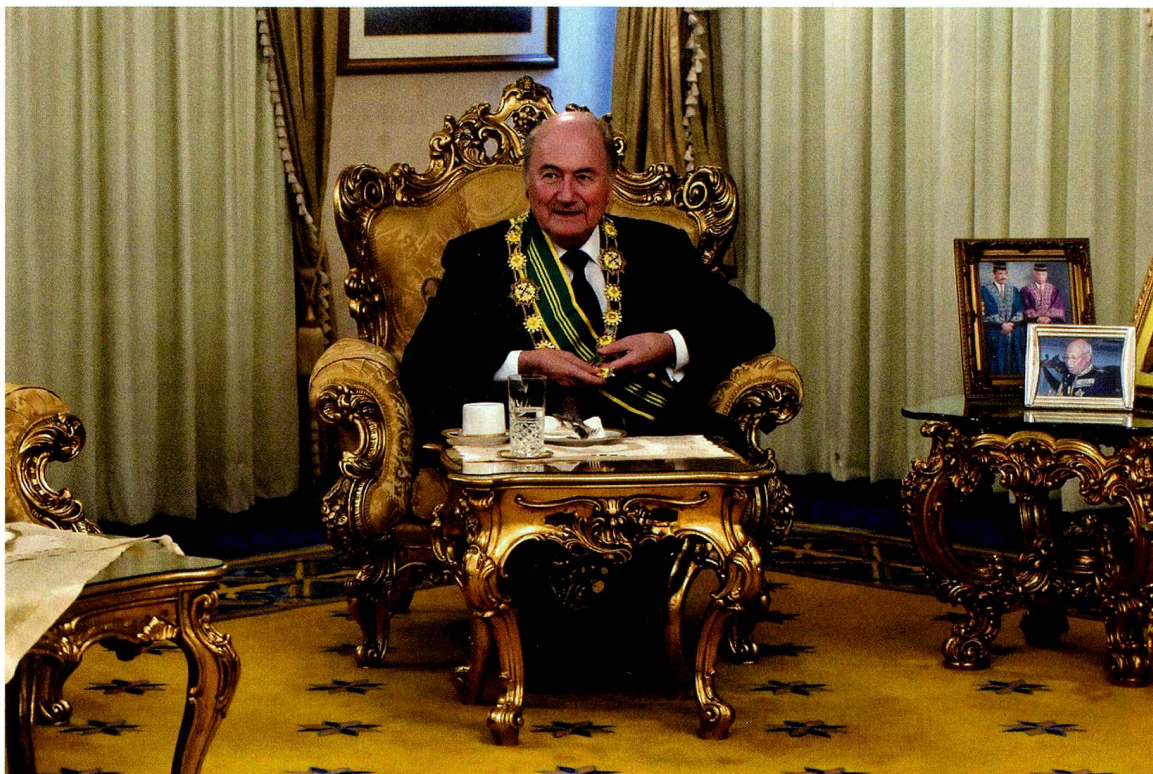
FIFA-Präsident Joseph «Sepp» Blatter als «First Class Grand Commander» im Royal Pahang Palace in Kuala Lumpur im März 2011

rund um den Erdball also garantiert. Werbefläche an einer WM ist extrem begehrt. Dies nutzt die FIFA bei Vertragsverhandlungen hemmungslos aus. 2006 buhlten die beiden amerikanischen Kreditkartenunternehmen VISA und Mastercard um Werbeplätze neben dem Fussballplatz. Mastercard war langjähriger Sponsoring-Partner der FIFA, doch das nützte ihnen gar nichts. Die FIFA verhandelte heimlich mit VISA und informierte diese sogar über die Offerten von Mastercard. Das sind keine Gerüchte, so steht es in Gerichtsakten der US-Justiz.