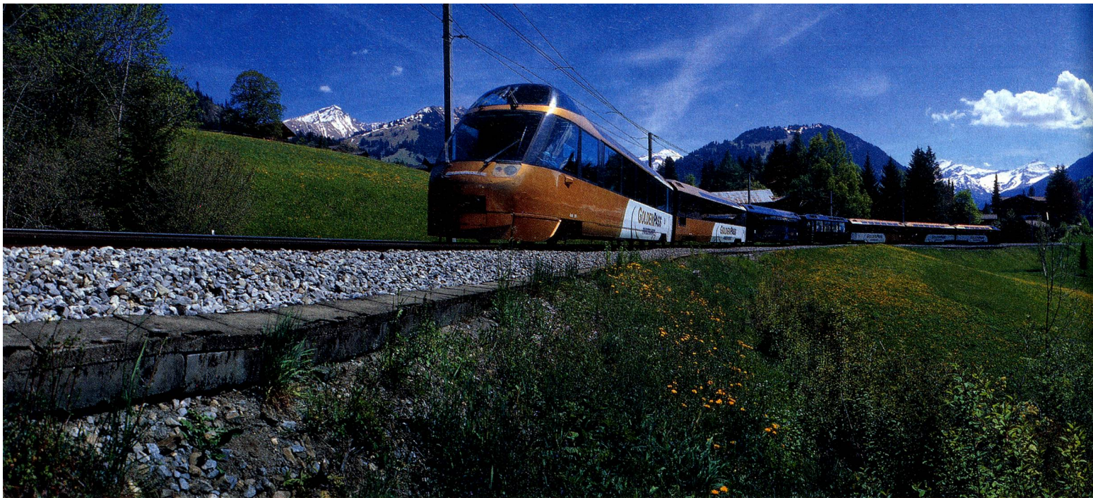
Panoramazug der GoldenPass Line, Berner Oberland