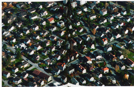
In der Nähe von Buchs in Kanton St. Gallen: Ein Einzelhaus reiht sich ans andere

Umweltfreundliche Urbanität mausert sich zum neuen Massstab. Im Gegensatz wird der bisher fest verankerte Schutz des Waldes zunehmend in Frage gestellt, obwohl ausgerechnet beim Waldschutz die Raumplanung des Bundes bisher am wirkungsvollsten war. Mit dem Grundprinzip, dass nur Wald roden darf, wer anderswo Wald auforstet, konnte die Waldfläche in den letzten Jahrzehnten auch im Mittelland erhalten werden.