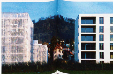
Königs im Schweizer Mittelland: Trotz Wacker-Preis für «ökologische Siedlungsentwicklung» nicht immer ein harmonisches Anblick