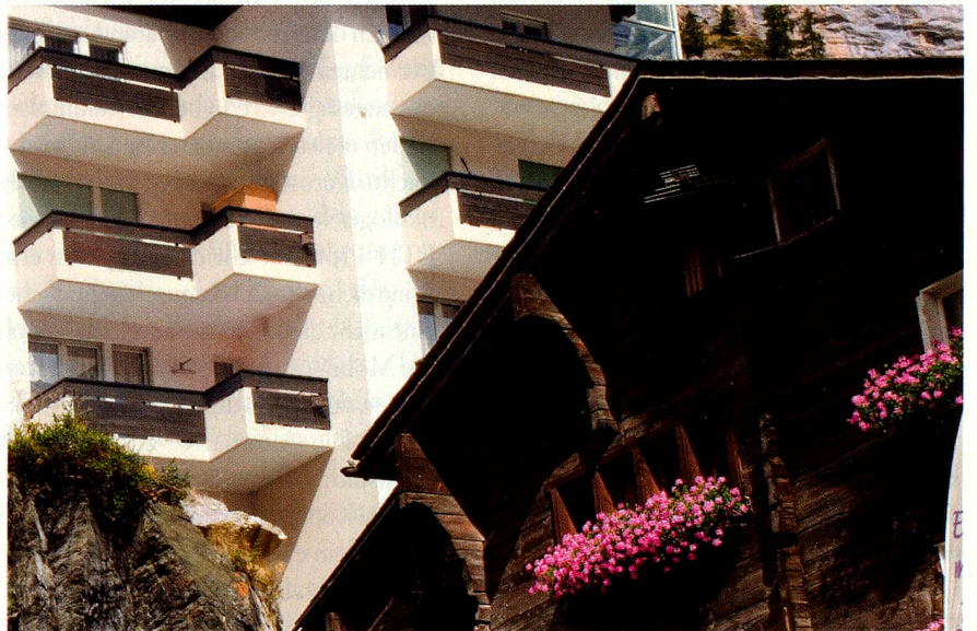
Davos und Zermatt: Die Bilder machen klar, warum die Zweitwohnungsinitiative angenommen wurde