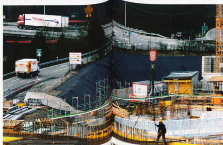
Grossbaustelle in Bern-Brünnen: Es entsteht ein Einkaufszentrum mit elf Kinosälen, zehn Restaurants, Hotel und Erlebnisbad

Doch jetzt wächst der Druck auf stadtnahe Wälder. Gegenwärtig führt Bern eine aufgeladene Debatte darüber, ob nicht Teile des Bremgartenwaldes zugunsten einer stadtnahen Siedlung für 8000 Menschen abgeholzt werden sollten. Das Hauptargument lautet, abgeholzter stadtnaher Wald führe zu weniger Zersiedelung als die Einzonung grüner Wiesen an der Peripherie des Stadtgebietes.