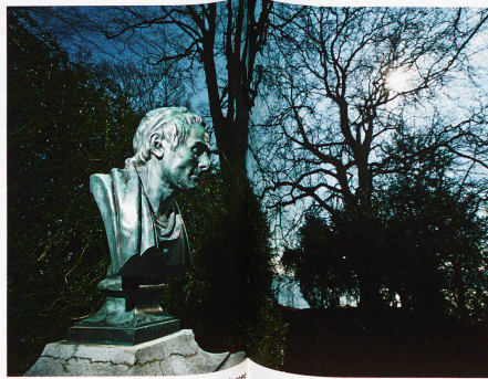
Rousseau-Denkmal auf der St. Petersinsel im Bielersee

Kommt dazu, dass es in seiner absoluten Republik ein absolutes Gemeinwohl gibt, ein gleichsam Staat gewordenem Interesse aller an Gleichheit und Freiheit, und das darf nie übergangen werden, auch nicht in einer Volksabstimmung. «Das setzt voraus, dass sämtliche Kennzeichen dieses Gemeinwillens