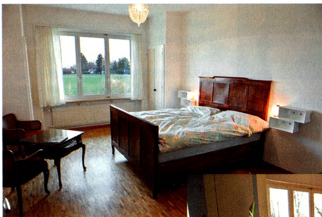
Im Klee, Bed & Breakfast, Melchenbühlweg 8, 3013 Bern +41 31 931 35 35 www.imklee.ch , schlafen@imklee.ch

tastischen Blick auf das Alpenpanorama – kosten zwischen 75 und 130 Franken pro Nacht (Einzel bzw. Doppel, bei längeren Aufenthalten gibt es Rabatt). Zwei Zimmer verfügen über fliessendes Wasser, Duschen und Toiletten befinden sich auf der Etage. Parkplätze vor dem Haus stehen zur Verfügung, öffentliche Verkehrsmittel und das renommierte Restaurant «Schöngrün» sind in unmittelbarer Nähe. BE