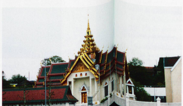
Gotteshäuser in der Schweiz: Kapelle bei Vrin im Kanton Graubünden Abteikirche von Römhorn im Kanton Waadt Synagoge von Baden im Kanton Aargau Mahmud Moschee in Zürich Buddhistischer Tempel in Gretzenbach im Kanton Solothurn

ten der Kirchen als vielmehr gesellschaftliche Megatrends ausschlaggebend sind. Die Megatrends sind globale soziale Veränderungsprozesse, die die Kirchen kaum beeinflussen können. Sie gehören ganz einfach zu jenen Rahmenbedingungen, mit denen die Kirchen in Zukunft werden rechnen müssen.