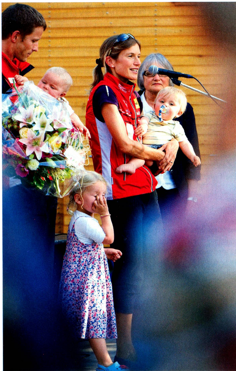
Mit Ehemann und Kindern beim Empfang in Münsingen nach der WM

sie gelassener und ausgeglichener sind, wenn sie hin und wieder etwas für sich selber machen. Das dient ja auch dem Kind.»