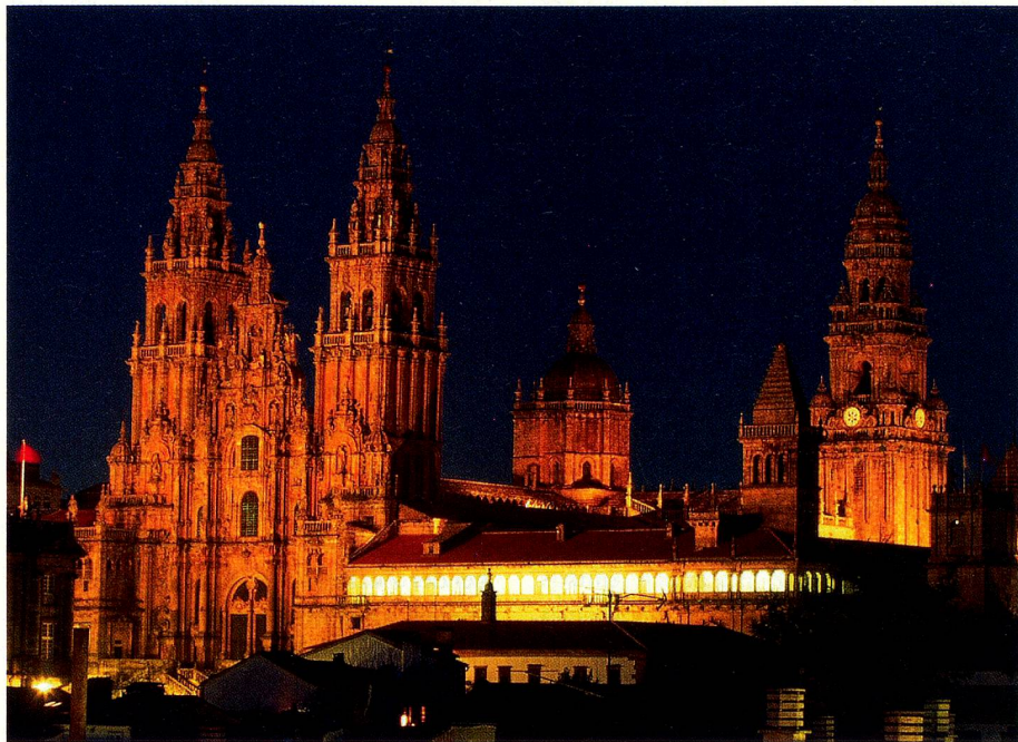
Die Kathedrale von Santiago de Compostela