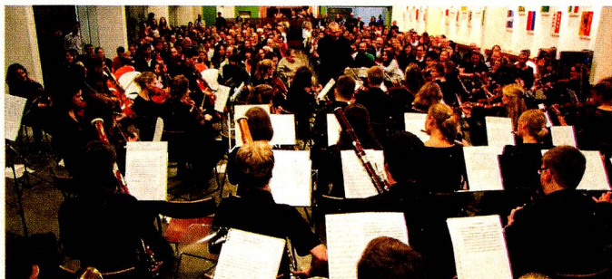
Orquestra Sinfônica Jovem da Basileia. www.esbsp.com.br