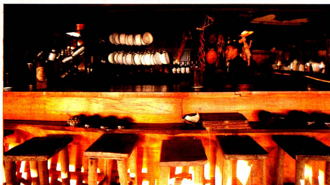
Palaphita Kitch

Queremos apresentar uma Suíça com a qual todos possam se identificar. É a hora de mostrar para os brasileiros que qualidade e precisão não precisam ser enfadonhas e que a informalidade combina com a sofisticação. Com esse projeto, temos a melhor oportunidade e visibilidade para fortalecer a sinergia entre o Brasil e a Suíça de uma forma positiva.