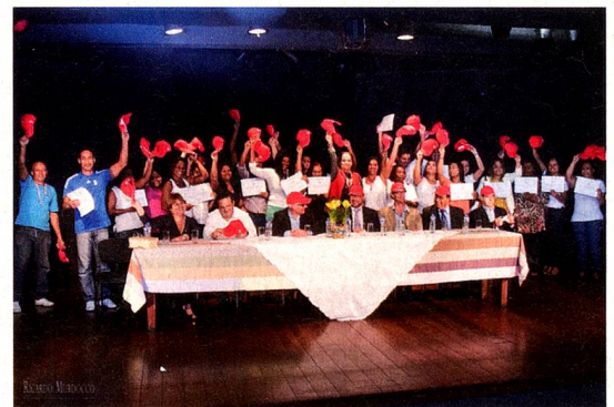
Entrega dos diplomas

O curso, no qual os participantes aprenderam a organizar e arrumar um quarto de hotel, durou 40 dias. Foi um sucesso! A maior parte dos participantes conseguiu um emprego na indústria hoteleira logo, após o curso.