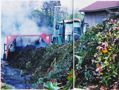
Die riesigen Mengen an Grünabfällen aus Gärten und Küchen werden, richtig entsorgt, zu Humus für Gärten