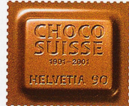
Die «Chocossuisse» von 2001 reicht nach Schokolade