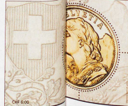
Die 6-Franken-Marke von 2013 mit 18 karätigem Gold