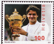
Auch lebende Stars wie Roger Federer sind als Sujets für Marken beliebt