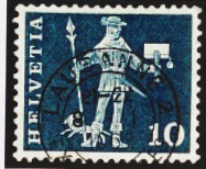
Fast 1,5 Milliarden wurden seit 1960 von dieser 10-Rappen-Marke gedruckt