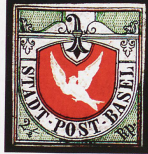
Teures Sammelstück: «Basler Tauben» von 1845