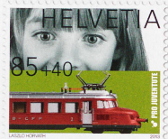
Pro-Juventute-Marke mit Wohltätigkeitszuschlag von 2013