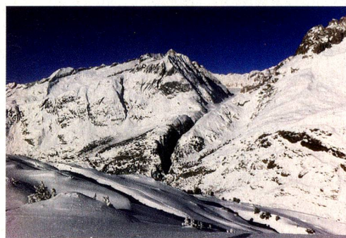
Die Aletscharena bei der Bettmeralp im Wallis

www.admin.ch/opc/de/federal-gazette/2014/7229.pdf