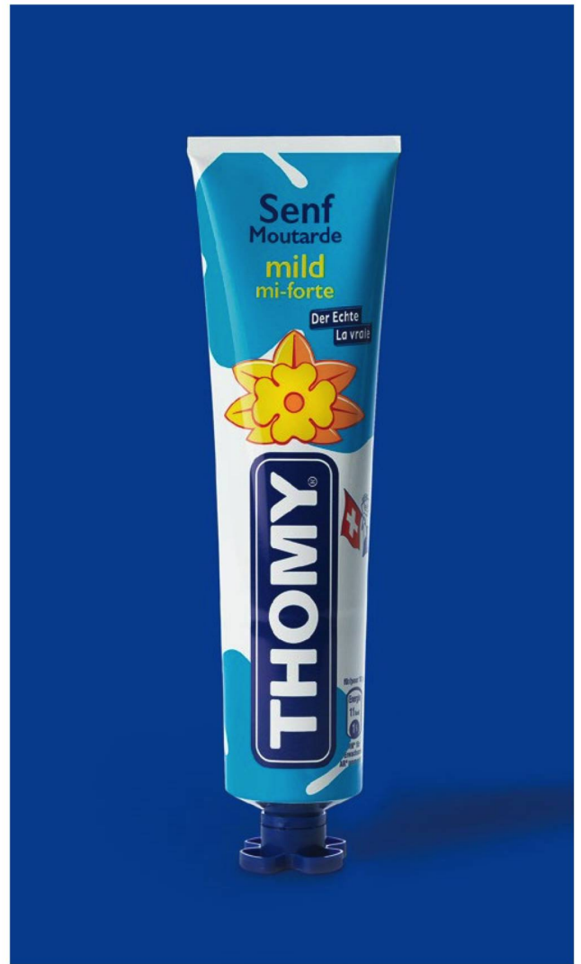
Der Schweizer Unternehmer Hans Thomi füllte den Senf ab 1934 zur besseren Haltbarkeit als Erster in Aluminiumtuben ab.