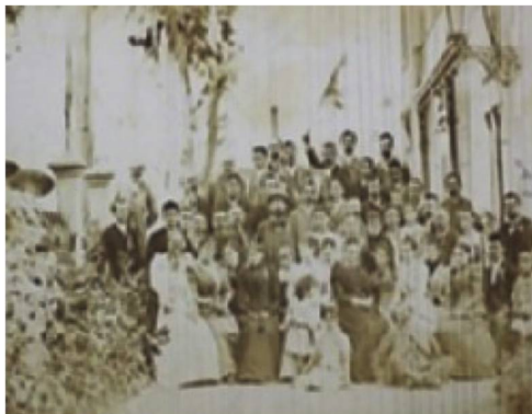
Die Schweizer Gemeinschaft in Portugal anlässlich der Bundesfeier vom 1. August 1892. La communauté suisse du Portugal lors de la commémoration du 1 er août 1892.

De 1946 à 2017, un grand nombre d'entreprises suisses s'installent au Portugal. Notre communauté augmente et les membres de notre Société aussi. De leur côté, les demandes d'aide diminuent. La fortune de la Société est en forte progression, principalement grâce aux dons des entreprises suisses. Elle se concentre sur la gestion de sa fortune et initie une activité « d'institut financier » de la communauté suisse du Portugal. En 1963, la Société Suisse de Lisbonne (Club Suisse), grâce aux dons de la famille Sandoz et de membres de notre communauté, fait l'acquisition de l'actuelle maison suisse de Lisbonne. A cette occasion notre Société lui accorde un prêt pour mener à bien les travaux de transformation nécessaires. En 1985, elle prête au Club Suisse de Porto la somme nécessaire à l'acquisition