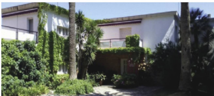
Entspricht Ihr Eigenheim allen geltenden Rechtsvorgaben? Correspondent votre immeuble a toutes les spécifications á droite valables?

Welche Folgen hat die Illegalität eines Baus? Es können (sehr hohe) Strafzahlungen festgesetzt werden. Die Fristen hierfür werden in den örtlichen Baugesetzen der einzelnen Autonomen Gemeinschaften geregelt. Daneben können Abrissverfügungen ergehen. Hierfür gelten je nach den örtlichen Baugesetzen ebenfalls unterschiedliche Fristen. Seit August 2014 beträgt diese in Valencia 15 Jahre ab Fertigstellung des Baus, auf den Balearen verjährt die Möglichkeit