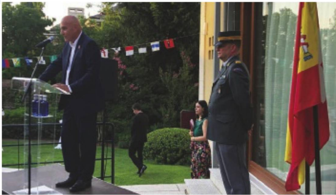
Botschafter Haas während seiner Rede... - L'Ambassadeur Haas lors de son discours...

Es ist schon Tradition, dass der Schweizer Botschafter für Spanien und Andorra zur 1. August-Feier in seine Residenz einlädt. Auch die-