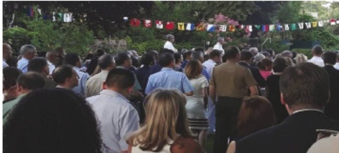
... welche von den Anwesenden mit Aufmerksamkeit verfolgt wurde. - ... qui a été suivie avec attention par les personnes présentes.