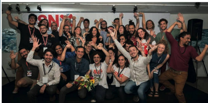
Participantes do Hackathon

(EPFL), na Suíça – que acrescenta a dimensão da respiração como possibilidade de interação dentro do ambiente de realidade virtual.