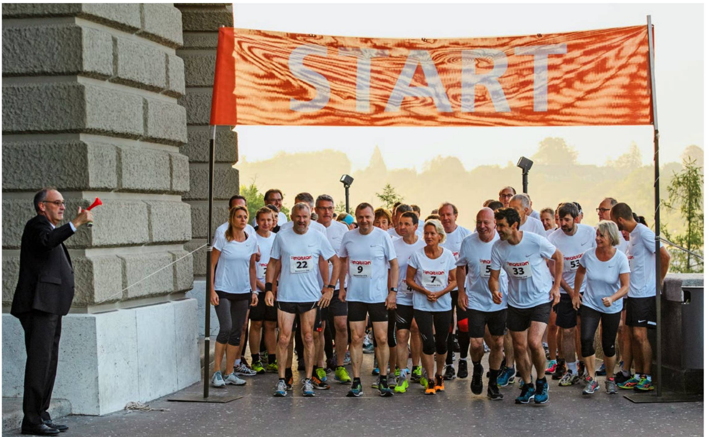
Am traditionellen Parlamentarierlauf umrunden National- und Ständeräte jedes Jahr das Bundeshaus. Doch jetzt beginnt das Rennen ins Bundeshaus.

Kurz nach den Wahlen von 2015 wählte das Parlament mit Guy Parmelin einen zweiten SVP-Vertreter in die Landesregierung. Damit waren die vier grössten Parteien wieder angemessen im Bundesrat vertreten (2 SVP, 2 SP, 2 FDP, 1 CVP), die Querelen der vergangenen Jahre um die Bundesratssitze vorerst beendet. Und der Rechtsruck bei den Nationalratswahlen pflügte die politische Landschaft nicht so stark um, wie da und dort erwartet. Der Bürgerblock ge-