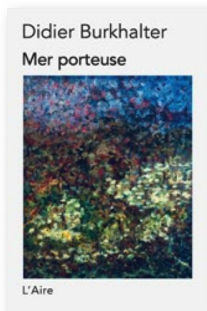
DIDIER BURKHALTER: «Mer porteuse». Editions de L'Aire, 2018, 194 Seiten CHF 24.00, Euro 24.00

«Mer porteuse», Didier Burkhalters drittes Werk, entstand am Neuenburgersee. Die poetische Prosa dreht sich um Abstammung und die Macht unserer familiären Wurzeln. Eine Hauptrolle in dieser Geschichte eines zurückgelassenen Kindes spielt der Atlantik, Symbol der Trennung, aber auch der Verbindung zwischen den Menschen. Der Altbundesrat schreibt mit geschliffener Feder, so etwa in der Passage, in der die Rauchwolken eines Ozeandampfers das Schiff mit dem Himmel verbindet, «als ob es sich fürchtete, von den Tiefen verschlungen zu werden». Der Schwachpunkt: eine gewisse Trägheit oder Schwülstigkeit in der Formulierung, welche die Indifferenz als «haarsträubend» und den Ozean überdeutlich als «Ozean der Verzweiflung» zu erkennen gibt, der eine der Romanfiguren überwältigt.