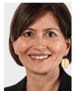
Regula Rytz Die grüne Berner Nationalrätin steht für einen zweifachen Erfolg: jenen der Grünen und jenen der Frauen.