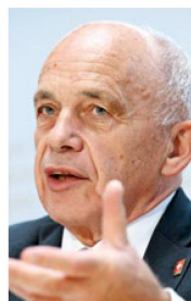
Finanzminister Ueli Maurer: Güter- abwägung gemacht.

Die Schweiz vermochte sich aber nicht aus der Gefahrenzone zu bewegen, auch weil Deutschschweizer Kantone der Pandemie wenig entgegensetzten, sehr zum Unwillen des Bundesrats. So herrschte im kleinen Land mit seinen 26 Kantonen und Halbkantonen eine verwirrlige Vielzahl divergierender Vorschriften. In der Bevölkerung nutzten sich die Appelle an die Selbstdisziplin sichtlich ab. Anfang Dezember stagnierten die Fallzahlen auf hohem Niveau und begannen in fast allen Kantonen wieder anzusteigen. Die Entwicklung belastete die Spitäler und Pflegeheime, die Plätze auf den Intensivstationen wurden knapp. In der Todesfallstatistik hinterliess die zweite Welle tiefe Spuren: Überdurchschnittlich viele ältere Menschen starben an Covid-19. Die Schweizer Corona-Todesrate war im internationalen