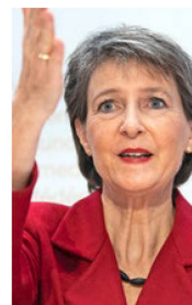
Bundespräsidentin Simonetta Sommaruga.