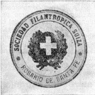
Primer sello de la Sociedad Filantrópica Suiza de Rosario

No es fácil historiar en breves palabras el desarrollo y la centenaria vida de esta Sociedad Filantrópica Suiza. Para ello hay que retroceder en el tiempo y ubicarse en una época que nos cuesta recordar.